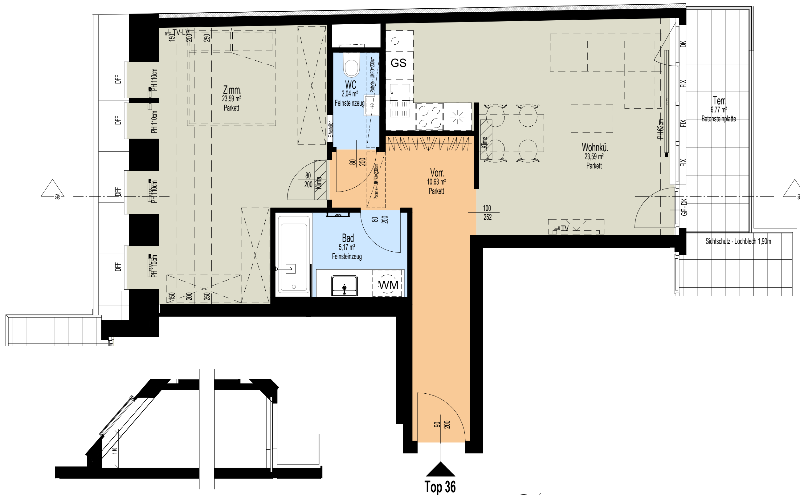
Schnitt 36A M 1 : 75